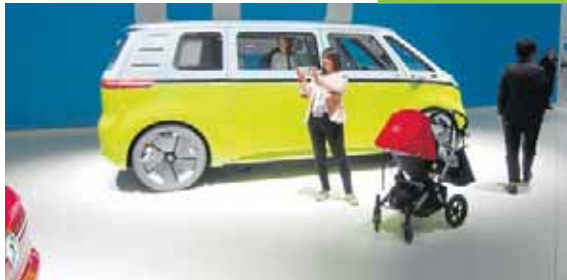
Democratizando el eléctrico

Volkswagen se ha propuesto democratizar y liderar la movilidad eléctrica. Para ello va a invertir 9.000 millones de euros en el desarrollo de esta tecnología para el lanzamiento de 20 nuevos modelos, uno de ellos el ID. Buzz: un vehículo de 8 plazas, reinterpretación del legendario Transporter T1.