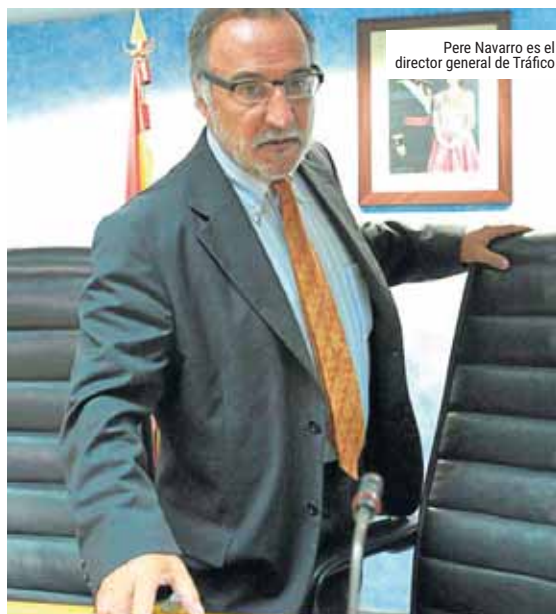
Pere Navarro es el director general de Tráfico

Navarro, que participó la pasada semana en la asamblea general del Observatorio Iberoamericano de Seguridad Vial (Oisevi) celebrado en Madrid, expuso que sí se ha avanzado en la atención de víctimas o