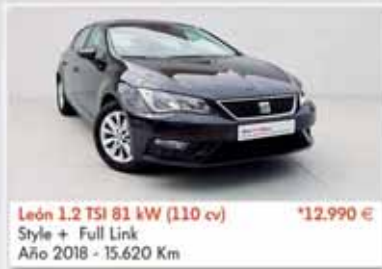
León 1.2 TSI 81 kW (110 cv) *12.990 € Style + Full Link Año 2018 - 15.620 Km.