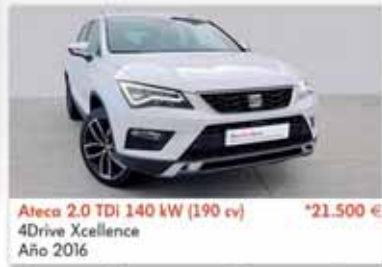
Ateca 2.0 TDI 140 kW (190 cv) *21.500 € 4Drive Xcellence Año 2016