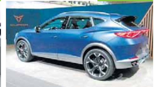
Cupra Formentor, enchufable

Con una carrocería de líneas deportivas, el Formentor es el primer modelo híbrido enchufable de Cupra. Está construido sobre la plataforma de los nuevos Golf y León, tiene una potencia de 245 caballos y una autonomía de 50 kilómetros.