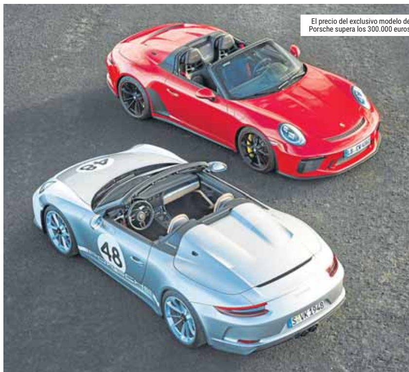
El precio del exclusivo modelo de Porsche supera los 300.000 euros

La firma alemana también ofrece, de forma opcional para el 911 Speedster, el paquete Heritage Design, que tiene un precio en España de 24.679 euros e incluye la combinación de color interior en negro y cognac, con detalles en oro. También, sobre la pintura básica del vehículo, en color plata GT metalizado, se aplican unas ban-