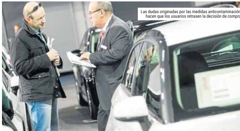
Las dudas originadas por las medidas anticontaminación hacen que los usuarios retrasen la decisión de compra

De este modo, ganan fuerzas alternativas como el renting, que en el último año ha pasado de ser una opción para el 5% hasta el 12%. El renting permite "que el usuario sienta que tiene un coche en propiedad, ganando tiempo sobre la decisión final de adquisición o no del vehículo en función