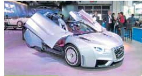
Debut de Carmen, el Hispano Suiza

El deportivo Carmen, de la marca española de superlujos Hispano Suiza, es un turismo totalmente eléctrico, con inspiración clásica. Solo se fabricarán 19 unidades y su precio superará el millón y medio de euros, más impuestos.