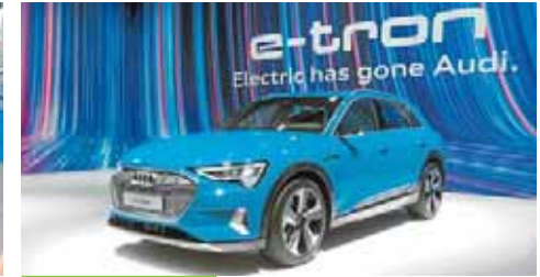
Audi e-tron 100% eléctrico

Con más de 400 kilómetros de autonomía, el e-tron es el primer modelo totalmente eléctrico que la firma de los cuatro anillos produce en serie. Llegó a España en marzo y está disponible a partir de 82.000 euros.