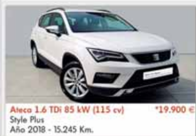
Ateca 1.6 TDI 85 kW (115 cv) *19.900 € Style Plus Año 2018 - 15.245 Km.