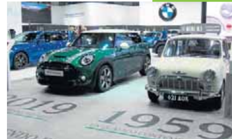
Mini, cada vez más joven

El salón del Centenario acoge otras celebraciones: el 120º aniversario de Opel, el 100º de Citroen o el medio siglo del Seat 1430. También nos encanta ver lo bien que mantiene su figura el Mini, 60 años después de su nacimiento.