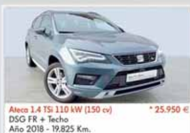
Ateca 1.4 TSI 110 kW (150 cv) * 25.950 € DSG FR + Techo Año 2018 - 19.825 Km.