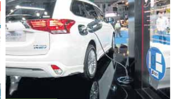
Mitsubishi Outlander PHEV

Con más de 400 kilómetros de autonomía, el e-tron es el primer modelo totalmente eléctrico que la firma de los cuatro anillos produce en serie. Llegó a España en marzo y está disponible a partir de 82.000 euros.