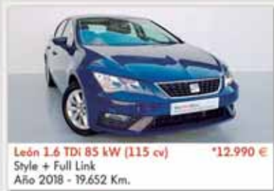
León 1.6 TDI 85 kW (115 cv) *12.990 € Style + Full Link Año 2018 - 19.652 Km.