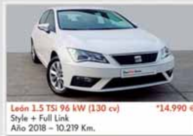
León 1.5 TSI 96 kW (130 cv) *14.990 € Style + Full Link Año 2018 - 10.219 Km.