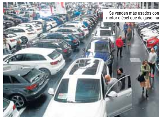
Se venden más usados con motor diésel que de gasolina