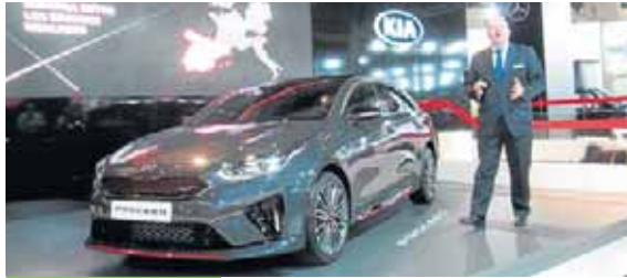
Kia desvela sus planes de futuro

El resto de las marcas son conscientes de que no pueden quedarse atrás, y, aunque tienen en desarrollo vehículos eléctricos, apuestan por hacer más eficientes sus motores de combustión y por ampliar sus opciones con versiones híbridas. Es el caso de la japonesa Subaru, que tiene en su stand el Forester híbrido, o de Renault, que presenta la quinta generación del Clio, un modelo que en 2020 recibirá su versión híbrida. Renault muestra también un prototipo de taxi del futuro, un robot-taxi eléctrico, conectado y autónomo. ●