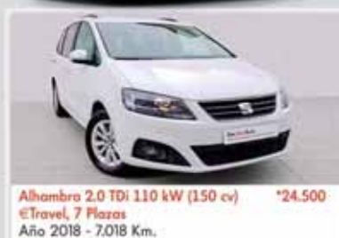
Alhambra 2.0 TDI 110 kW (150 cv) *24.500 € Travel, 7 Plazas Año 2018 - 7.018 Km.