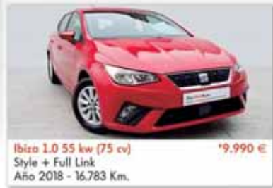
Ibiza 1.0 55 kW (75 cv) *9.990 € Style + Full Link Año 2018 - 16.783 Km.