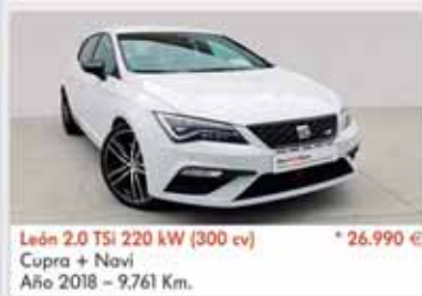
León 2.0 TSI 220 kW (300 cv) * 26.990 € Cupra + Navi Año 2018 - 9.761 Km.