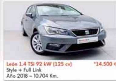
León 1.4 TSI 92 kW (125 cv) *14.500 € Style + Full Link Año 2018 - 10.704 Km.