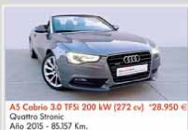
A5 Cabrio 3.0 TFSI 200 kW (272 cv) *28.950 € Quattro Stronic Año 2015 - 85.157 Km.