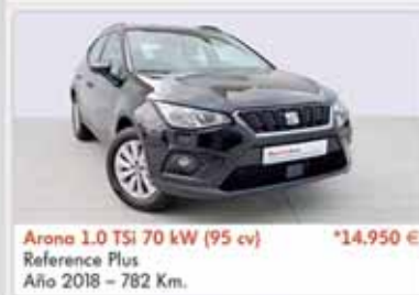
Arona 1.0 TSI 70 kW (95 cv) *14.950 € Reference Plus Año 2018 - 782 Km.