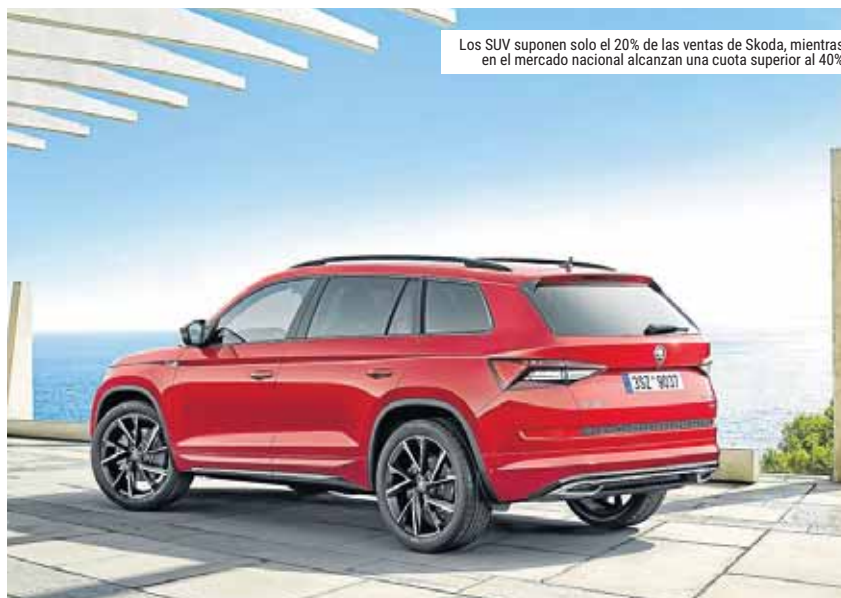
Los SUV suponen solo el 20% de las ventas de Skoda, mientras que en el mercado nacional alcanzan una cuota superior al 40%

Más del 20% de los vehículos que la marca automovilística Skoda