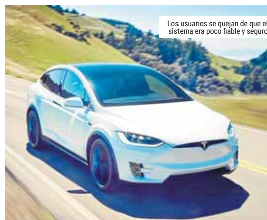
Los usuarios se quejan de que el sistema era poco fiable y seguro

Los demandantes argumentaban que habían abonado 5.000 dólares adicionales para equipar sus vehículos con el Autopilot, del que la empresa afirmaba que aportaba prestaciones adicionales de seguridad, pero aseguraban que, de hecho, este "no era operativo". ●