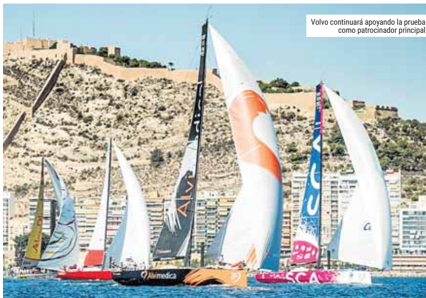
Volvo continuará apoyando la prueba como patrocinador principal