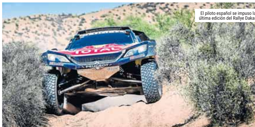
El piloto español se impuso la última edición del Rallye Dakar

Sainz participó en los actos conmemorativos del 60 aniversario de la planta gallega