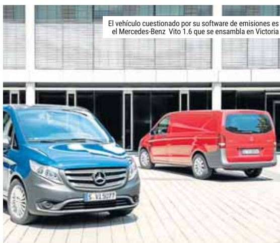
El vehículo cuestionado por su software de emisiones es el Mercedes-Benz Vito 1.6 que se ensambla en Victoria