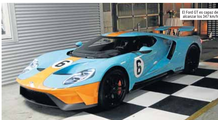
El Ford GT es capaz de alcanzar los 347 km/h

Hace prácticamente un año, en abril de 2016, se realizaron 6.506 solicitudes para ser uno de los propietarios de las 500 primeras unidades del Ford GT que ahora, por fin, están comenzando a llegar a sus propietarios en Europa. ●