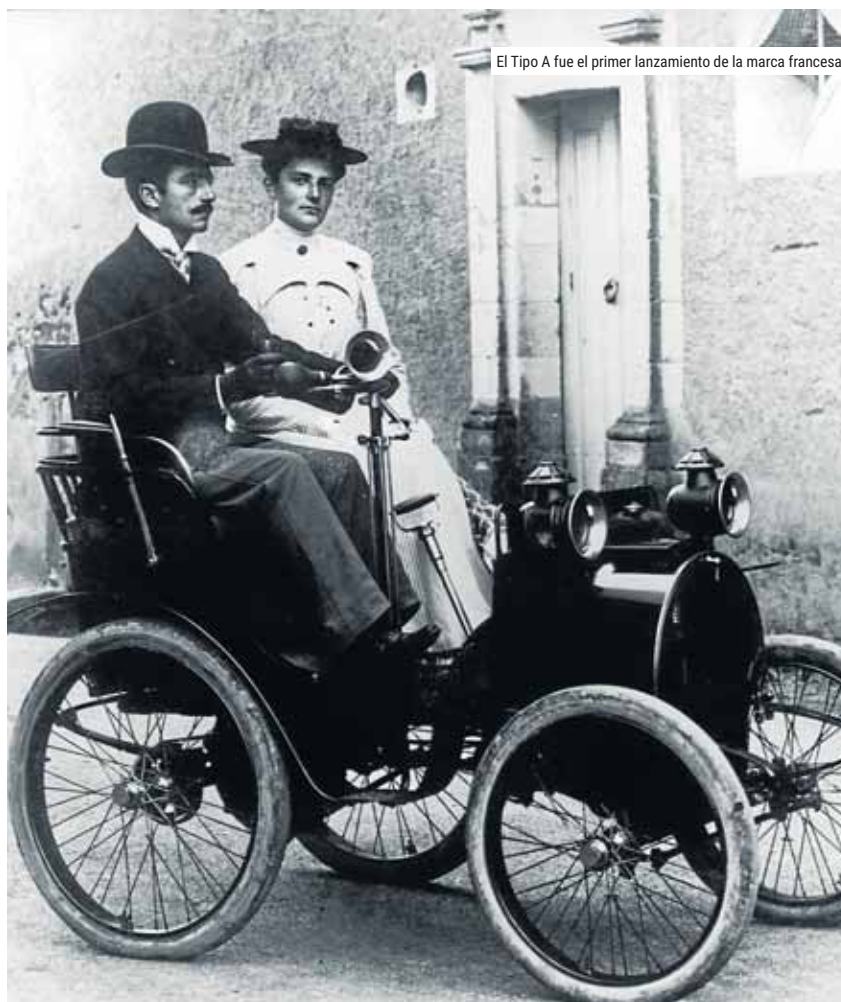
El Tipo A fue el primer lanzamiento de la marca francesa

Otra de las fechas destacadas de la firma fue 1984, cuando lanzó un nuevo segmento de vehículos, el monovolumen Espace, un nuevo concepto diseñado para la convivencia. Ya entonces, el Espace era extremadamente modulable gracias a sus asientos individuales desmontables e intercambiables que favorecían la conversión y la convivencia a bordo. Con una posición de conducción alta, piso plano y el gran volumen de a bordo, el Espace proporcionaba un confort de conducción inédito. ●