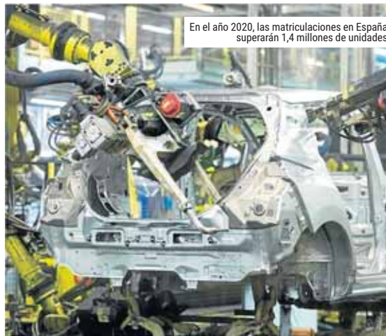
En el año 2020, las matriculaciones en España superarán 1,4 millones de unidades

Por otra parte, los turismos y todoterrenos de entre seis y nueve años de edad que circulan por las carreteras españolas sumarán 3,14 millones de unidades este año, un 13,5% del total. En el año 2020, la previsión es de 2,93 millones de unidades, reduciendo su cuota sobre el total hasta el 12,3%. ●