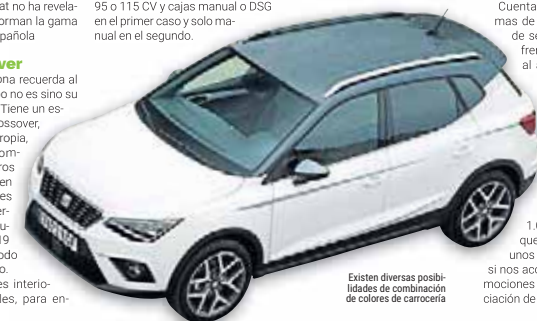
Existen diversas posibilidades de combinación de colores de carrocería

En gasolina hay tres opciones, todas ellas sobre la base del 1.0 TSI de tres cilindros: una de 95 CV con caja manual o DSG. La oferta diésel se cubre con el 1.6 TDI de 95 o 115 CV y cajas manual o DSG en el primer caso y solo manual en el segundo.