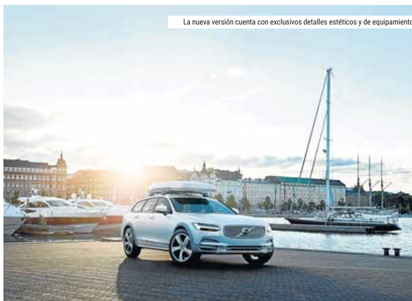
La nueva versión cuenta con exclusivos detalles estéticos y de equipamiento

Un diseño especial y expresivo, así como exclusivos colores en el exterior y en el interior, diferencian a este V90 Cross Country Volvo