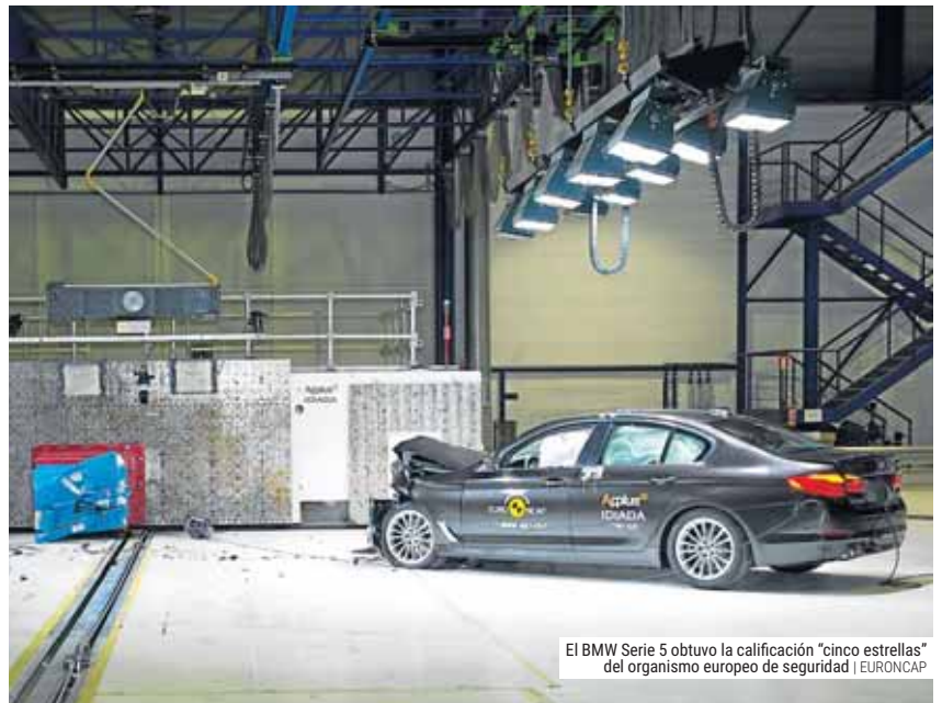
El BMW Serie 5 obtuvo la calificación "cinco estrellas" del organismo europeo de seguridad | EURONCAP

El organismo indicó que la versión probada representa la actualización de 2015, por lo que los resultados de los test ponen de manifiesto la edad del modelo y mostró su decepción con los resultados de la marca italiana por "la falta de ambición para competir en seguridad con otros modelos