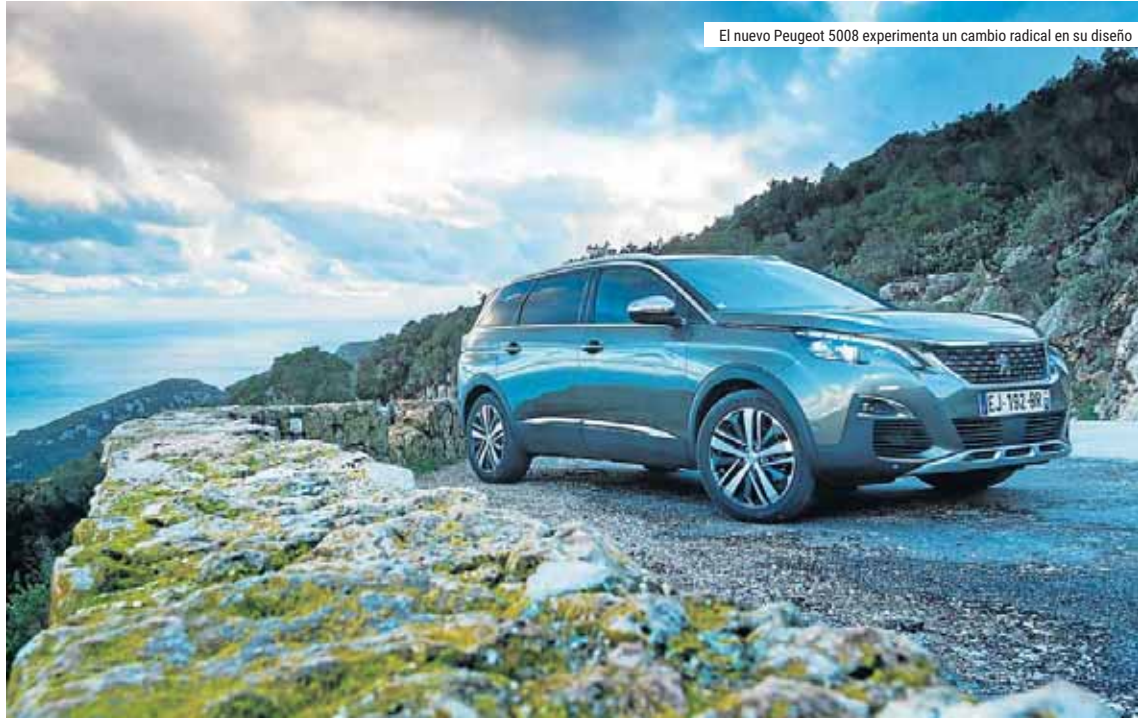
El nuevo Peugeot 5008 experimenta un cambio radical en su diseño

El nuevo SUV de Peugeot se presenta ofrece una gran habitabilidad. A las dos cómodas butacas delanteras suma tres asientos independientes, escamoteables, en la segunda fila y otros dos asientos escamoteables y extraíbles en la tercera fila. Dispone del maletero con mayor volumen de su categoría,