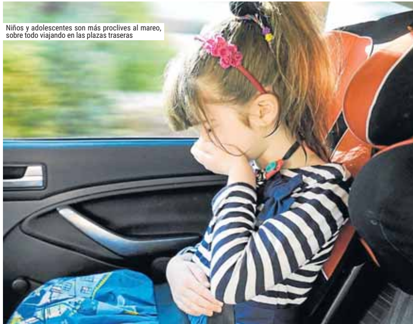
Niños y adolescentes son más proclives al mareo, sobre todo viajando en las plazas traseras

Los bostezos y la sudoración son señales de aviso para una afección causada por desequilibrios entre señales que recibe el cerebro desde los ojos y los órganos responsables del equilibrio, en el oído. Los bebés no se marean. Solo empiezan a hacerlo cuando arrancan a caminar. A las mascotas sí les afecta e, increíblemente.