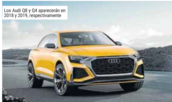
Los Audi Q8 y Q4 aparecerán en 2018 y 2019, respectivamente

Con el Audi Q8, la marca abrirá un nuevo segmento en sus modelos de alta gama. Se trata de un SUV premium con estilo cupé que combina una gran habitabilidad con un diseño deportivo y ofrece la última tecnología en sistemas de infotainment y asistencia al conductor. La planta