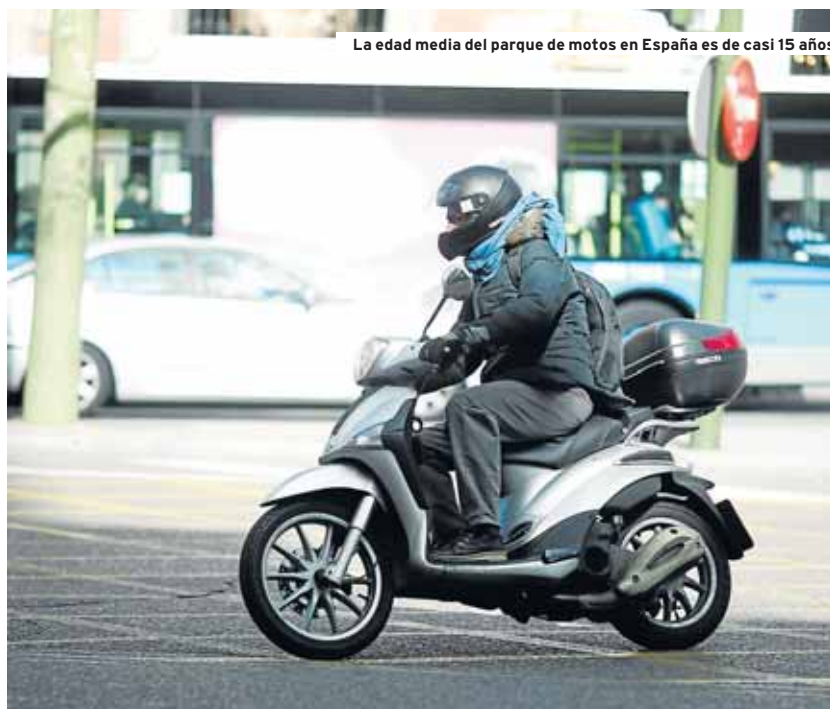
La edad media del parque de motos en España es de casi 15 años

Anesdor promueve un plan de movilidad sostenible a través de diferentes ayuntamientos de Es-