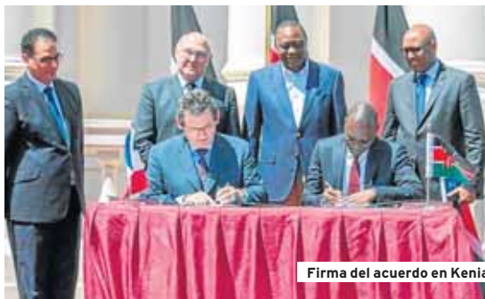
Firma del acuerdo en Kenia

como parte del programa Citroen Advanced Comfort, con elementos como la función "retro-vision high-tec", con dos cámaras laterales que reemplazan a los tradicionales retrovisores exteriores. ■