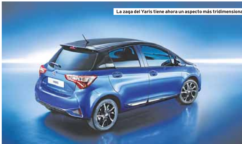
La zaga del Yaris tiene ahora un aspecto más tridimensional

En lo referente a su imagen exterior, el Yaris ha visto renovado su frontal, con nuevo paragolpes delantero y una parrilla con forma de panal de abeja. Las modificaciones efectuadas en la parte posterior le dotan de un aspecto más tridimensional. Otras novedades son los faros delanteros de nuevo diseño, así como de un portón trasero actualizado, mientras que en el interior se perciben nue-