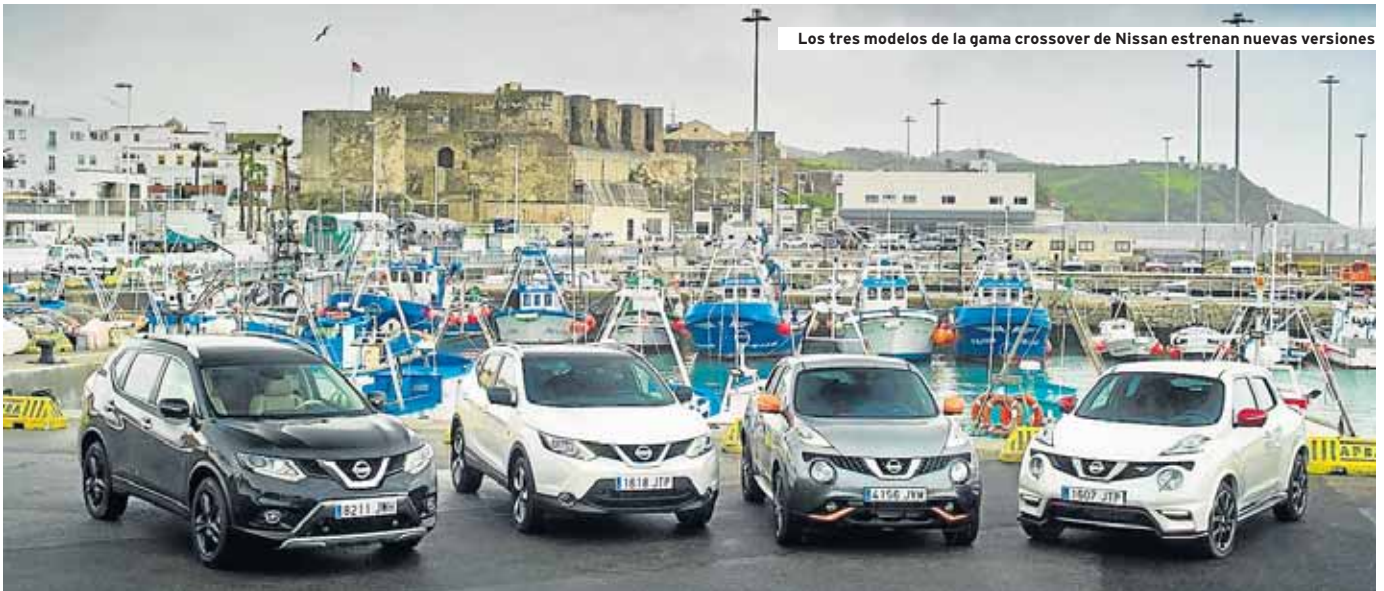
Los tres modelos de la gama crossover de Nissan estrenan nuevas versiones

la versión especial Dark Sound Edition del Juke, que se ofrecerá con motor diésel 1.5 dCi de 110 CV o con uno de gasolina 1.2 DIG-T de 115 CV, sobre la base de acabado N-Connecta. Va equipado con un kit de personalización exterior que incluye los embellecedores de faros y de parachoques delantero y trasero, además de carcasas para los retrovisores. Todo el equipamiento exterior es en color negro Tokyo, al igual que la personalización interior que incluye la consola central, los embellecedores de puertas, las costuras de la tapicería y las salidas de aireación. ■