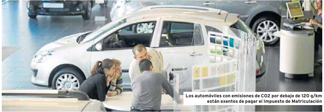
Los automóviles con emisiones de CO2 por debajo de 120 g/km están exentos de pagar el Impuesto de Matriculación

En 2016 se matricularon en España un total de 829.230 vehículos con cifras de emisiones comprendidas entre 90 y 120 g/km de CO2. De llevarse adelante esta modificación, todos estos coches habrían de cotizar el 4,75% de Im-