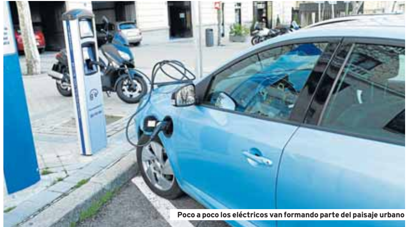
Poco a poco los eléctricos van formando parte del paisaje urbano

Por otro lado, todos los coches eléctricos actuales van dotados de sistemas de recuperación de energía, que recargan las baterías invirtiendo el funcionamiento de los motores eléctricos, convirtiéndolos en frenos. De este modo, cada vez que se suelta el acelerador, el sistema de regeneración de energía entra en funcionamiento y ejerce una fuerza de deceleración similar a la que se experimenta en un coche convencional