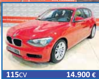
115CV 14.900 € BMW 116D EDITION