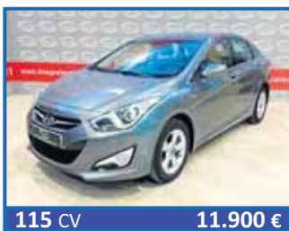
115 CV 11.900 € HYUNDAI I40 KLAS 1.7