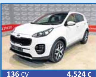
136 CV 4.524 € KIA SPORTAGE GT LINE 4X4 1.2