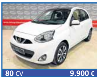
80 CV 9.900 € NISSAN MICRA TEKNA 1.2