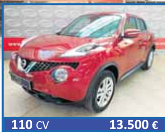
110 CV 13.500 € NISSAN JUKE ACENTA 1.5