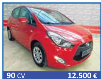
90 CV 12.500 € HYUNDAI IX20 1.4