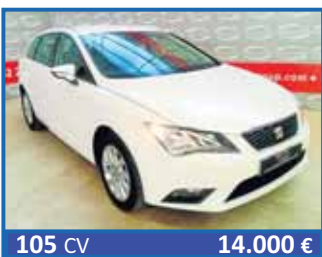
105 CV 14.000 € LEÓN ST STYLE 1.6