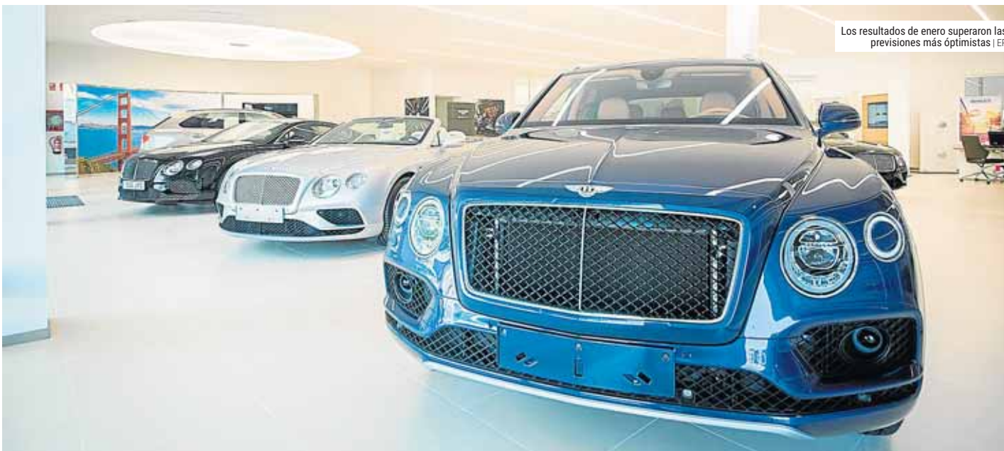
Los resultados de enero superaron las previsiones más optimistas