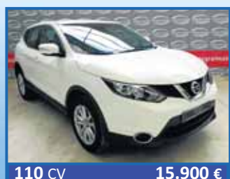
110 CV 15.900 € NISSAN QASHQAI ACENTA 1.5