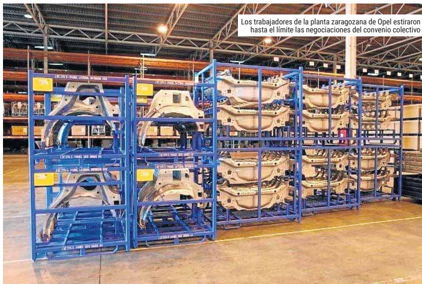
Los trabajadores de la planta zaragozana de Opel estiraron hasta el límite las negociaciones del convenio colectivo