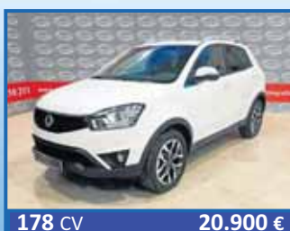
178 CV 20.900 € SSANYONG KORANDO D22T LIMITED 2.2