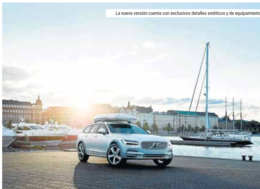
La nueva versión cuenta con exclusivos detalles estéticos y de equipamiento

Un diseño especial y expresivo, así como exclusivos colores en el exterior y en el interior, diferencian a este V90 Cross Country Volvo