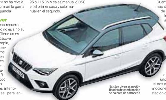
Existen diversas posibilidades de combinación de colores de carrocería

En gasolina hay tres opciones, todas ellas sobre la base del 1.0 TSI de tres cilindros: una de 95 CV con caja manual o DSG. La oferta diésel se cubre con el 1.6 TDI de 95 o 115 CV y cajas manual o DSG en el primer caso y solo manual en el segundo.