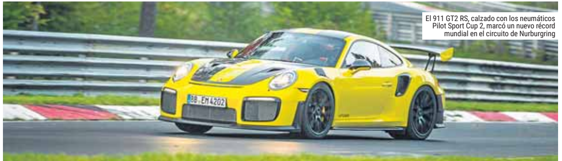
El 911 GT2 RS, calzado con los neumáticos Pilot Sport Cup 2, marcó un nuevo récord mundial en el circuito de Nürburgring

Los Pilot Sport Cup 2, que incorporan tecnologías desarrolladas en las competiciones de motor del más alto nivel, son ya equipo original de numerosos coches de alta gama del constructor alemán, incluyendo los Porsche 918 Spyder, Cayman GT4, 911 GT3 y 911 GT3 RS. Gracias a estas homologaciones como primer equipo, los conductores de vehículos de serie pueden benefi-