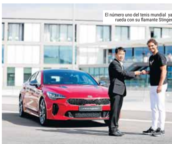
El número uno del tenis mundial ya rueda con su flamante Stinger

El Kia Stinger Kia se ofrece con una gama de tres motores: un 2.0 turboalimentado de 255 caballos, el poderoso V6 biturbo de 3,3 litros y 370 caballos -ambos de gasolina-, y un turbodiesel de 2,2 litros y una potencia de 200 caballos. ●