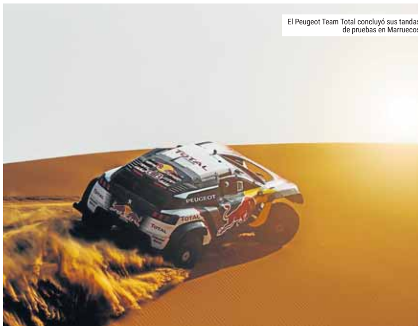
El Peugeot Team Total concluyó sus tandas de pruebas en Marruecos

Los cuatro equipos del "Dream Team Peugeot" suman, sobre dos o cuatro ruedas, 19 victorias absolutas y 148 victorias de etapa, lo que les convierte en la formación con mayor palmarés de la historia