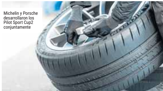
Michelin y Porsche desarrollaron los Pilot Sport Cup 2 conjuntamente

ciarse de los más altos niveles de duración, adherencia, manejabilidad y seguridad que proporcionan las avanzadas tecnologías de los neumáticos Michelin.