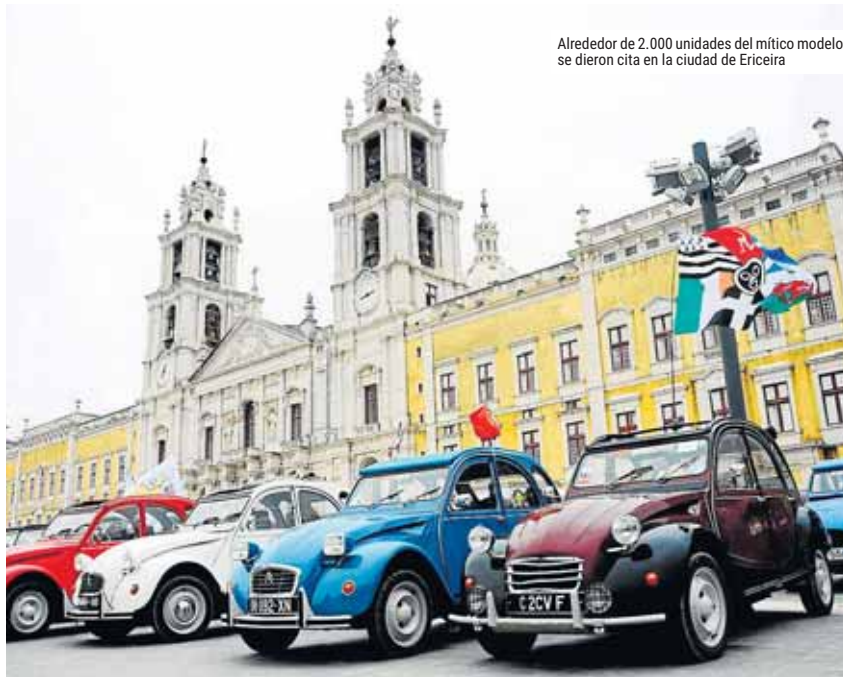
Aledor de 2.000 unidades del mítico modelo se dieron cita en la ciudad de Ericeira

Toda la historia de los modelos Citroën en el museo virtual www.citroenorigins.es .