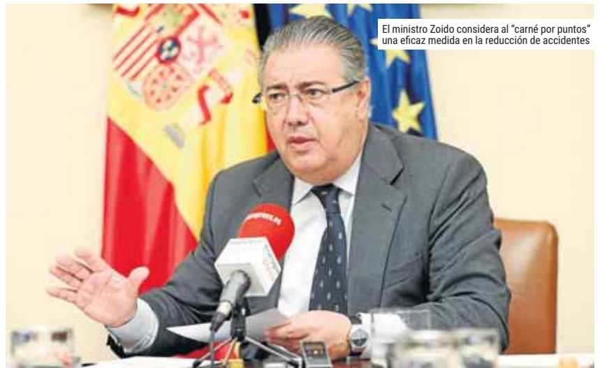
El ministro Zoido considera al "carné por puntos" una eficaz medida en la reducción de accidentes

Zoido recordó que están en marcha "campañas de sensibilización para que no se utilicen móviles, se use el cinturón de seguridad, con una mayor presencia de