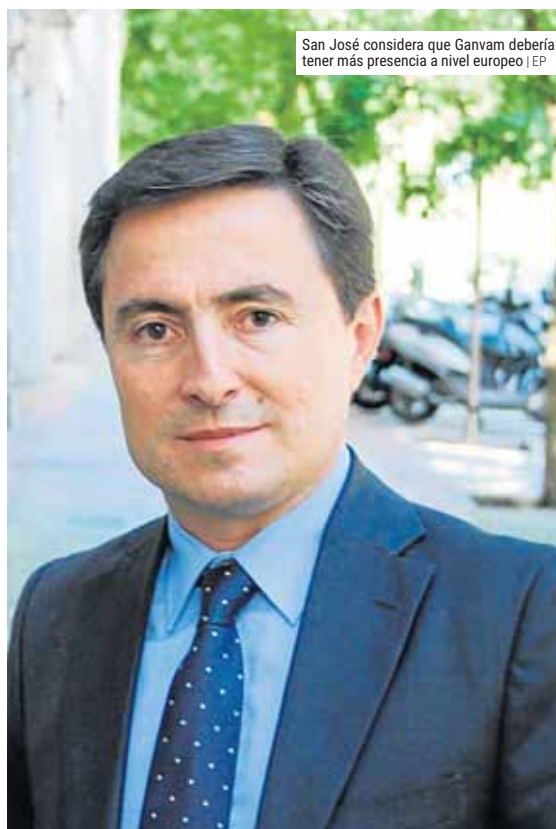
San José considera que Ganvam debería tener más presencia a nivel europeo

En esta línea, destacó también la necesidad de potenciar el mercado de vehículos de segunda mano con menos de cinco años de antigüedad y apostó por endu-