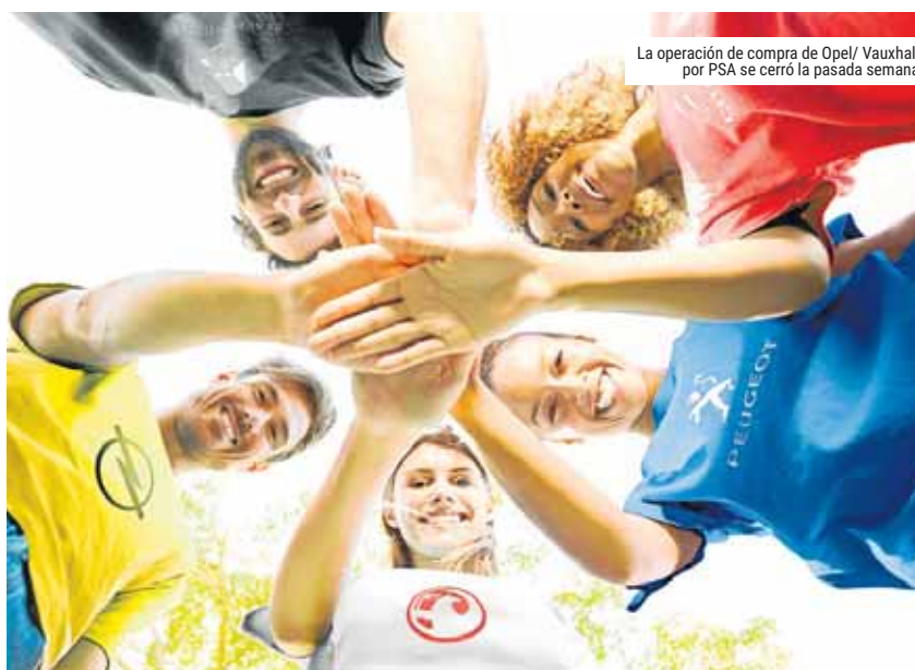
La operación de compra de Opel/ Vauxhall por PSA se cerró la pasada semana

Como parte de esta operación se han realizado diferentes nombramientos y cambios en departamentos clave de la estructura directiva de la corporación alemana, ahora asumidos por directivos procedentes del Grupo PSA. ●