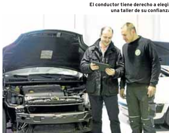
El conductor tiene derecho a elegir un taller de su confianza

Sin embargo, la aseguradora contratada le comunicó a su cliente que debía llevar el vehículo sinistrado a un taller concertado. De esta manera, la parte demandada alegó que si el demandante quería reparar su vehículo en el taller de su elección debería haber contratado la cobertura de libre elección de taller. Sin embargo, la sentencia dictamina que del examen de las condiciones de la póliza no queda acreditado que la libre elección del taller esté expresamente excluida.