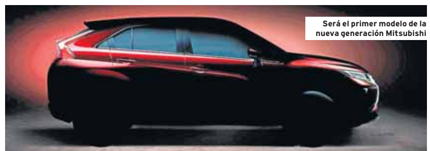
Será el primer modelo de la nueva generación Mitsubishi

El nuevo modelo que Mitsubishi dará a conocer en el Salón de Ginebra muestra un aspecto deportivo y, según el fabricante asiático, representa "un paso más" en el reposicionamiento gradual de la empresa como uno de los principales actores en el segmento SUV. ■