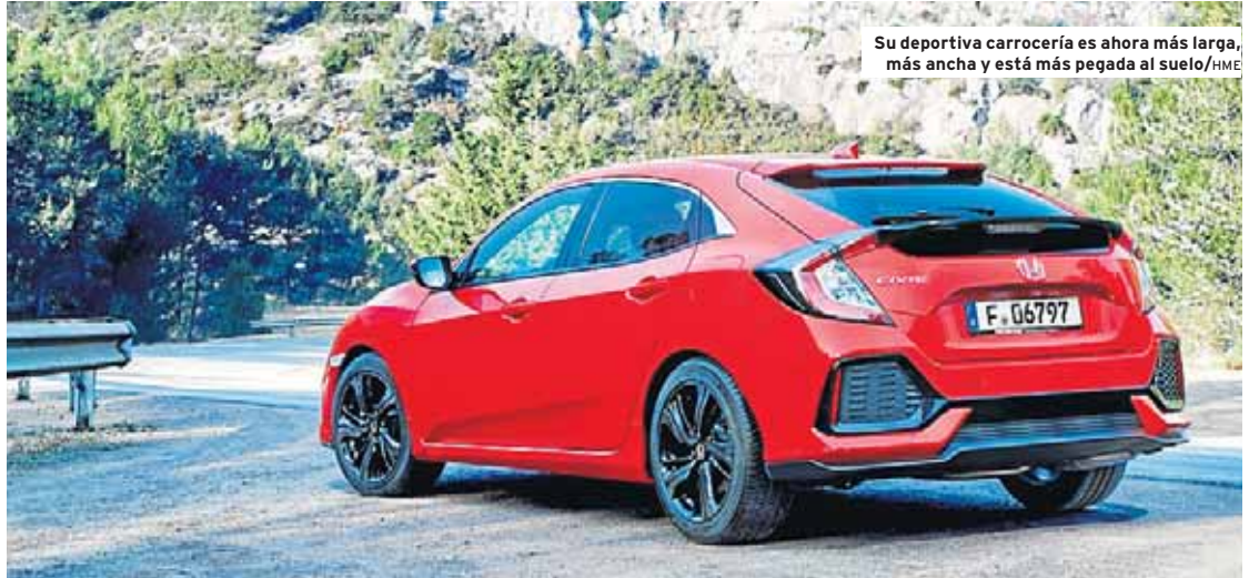
Su deportiva carrocería es ahora más larga, más ancha y está más pegada al suelo

Paseando la vista por su carrocería, observamos una imagen renovada, en la que destaca la parrilla delantera más ancha y los grupos ópticos frontales que ahora cuentan con tecnología LED. Sus dimensiones han crecido; es 15 cm más largo y 3 cm más ancho que su predecesor y su batalla es, también, 10 cm mayor. Todo ello, unido a un recorte de 4 cm en su altura y a un