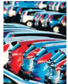
Más matriculaciones este año

Ford comunicó hace unos días que paralizaba su plan de construir una factoría en México, un proyecto valorado en 1.600 millones de dólares para inyectar 700 millones de dólares en Michigan. Ford tiene previsto trasladar la fabricación del Focus de Michigan a México, aunque lo hará a una instalación productiva que ya está operativa en territorio mexicano, en vez de construir otra. ■