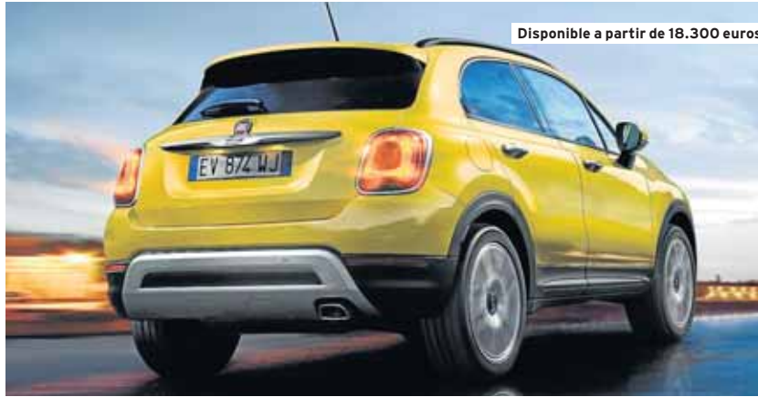
Disponible a partir de 18.300 euros

La gama se refuerza con nuevas llantas de aleación ligera de 17 pulgadas en la versión Lounge y con tres colores novedosos de carrocería. Además, la versión Off-Toad Look incorpora unas nuevas placas protectoras,