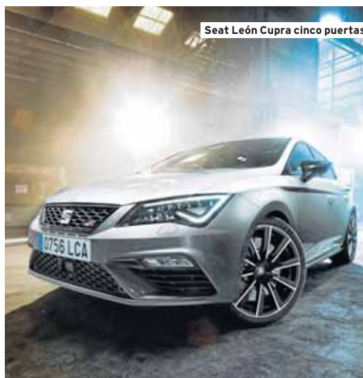
Seat León Cupra cinco puertas

El abanico de precios es muy amplio y abarca desde los 18.300 euros de la versión de acceso, hasta los 29.700 euros la más alta de gama. ■